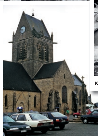
Kirken St. Mere Eglise 2008.