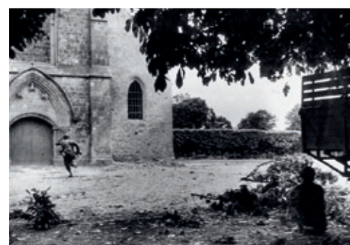
Kirken St. Mere Eglise 1944.