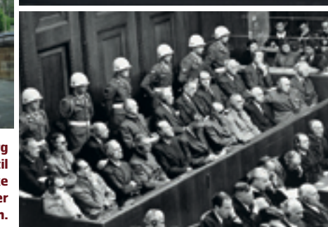
Retssalen i Nürnberg dengang og nu, og til højre de nazistiske ledere bænket under retssagen efter krigen.