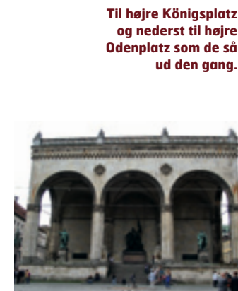
Til højre Odeonplatz og nederunder Führerbau som de tager sig ud i dag.