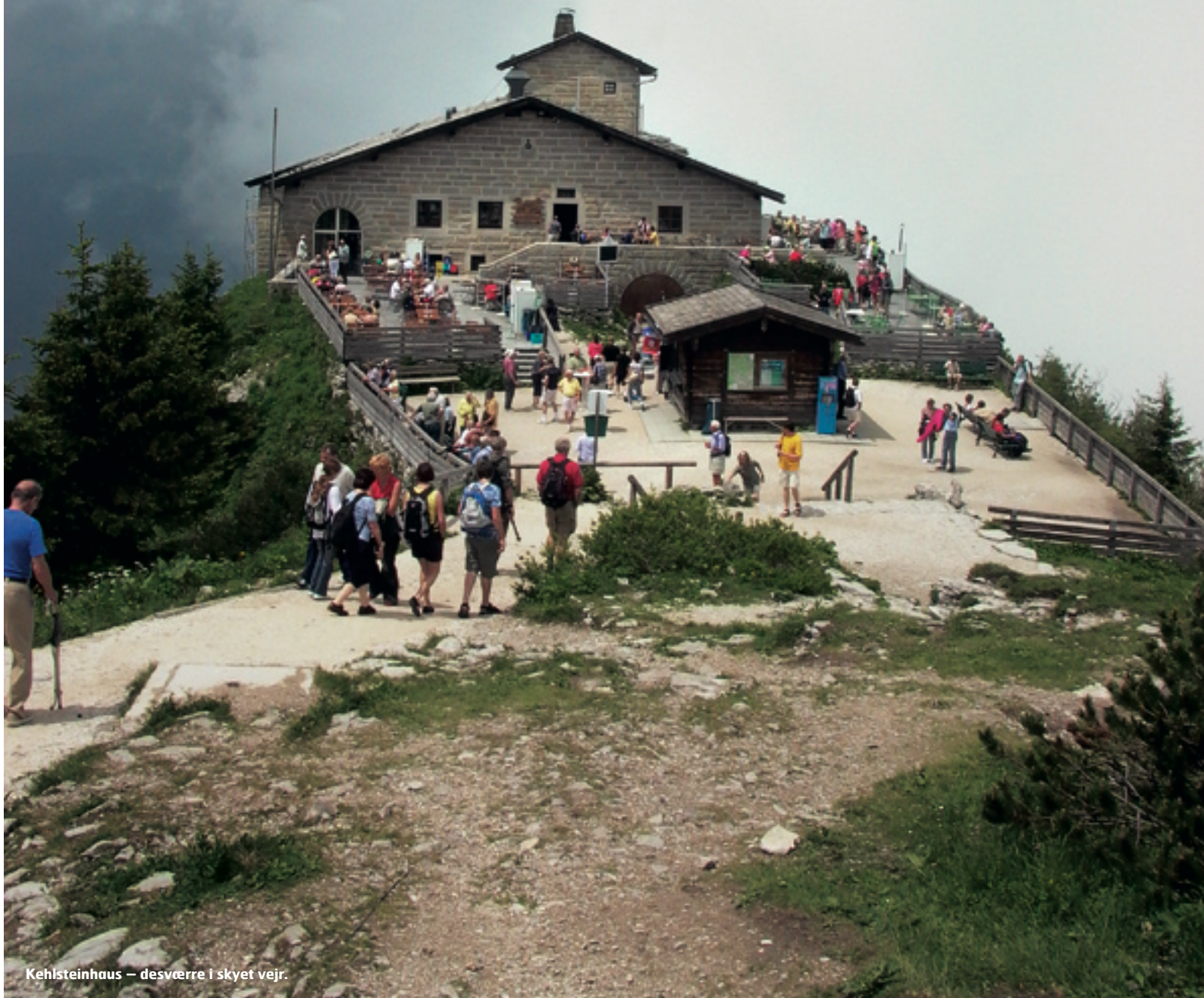
Kehlsteinhaus – desværre i skyet vejr.

TEKST: CAND. MAG. TORSTEN GRANOV