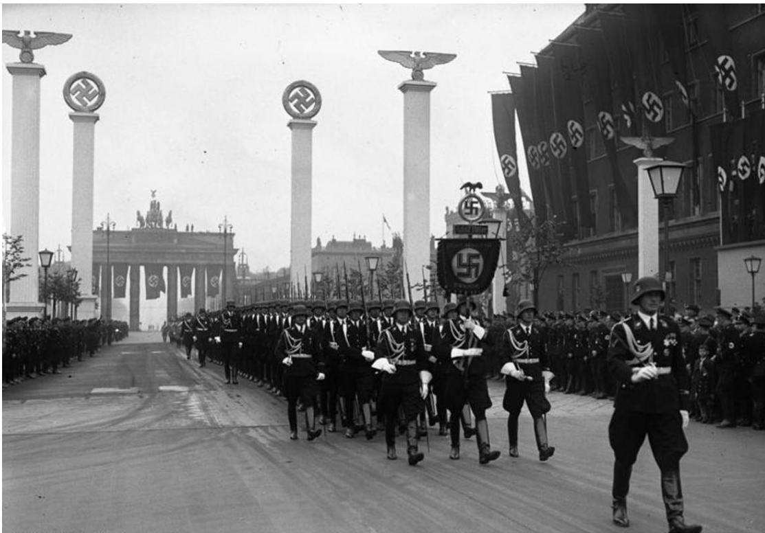
20. April 1939