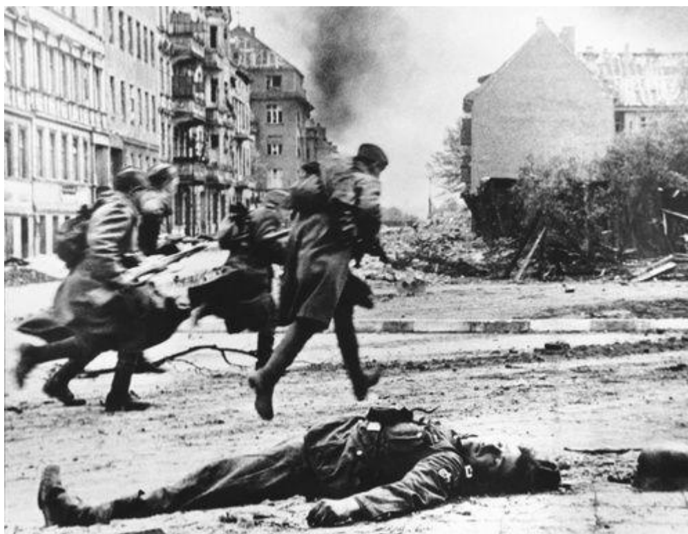
Berlin, april 1945: Sovjetiske soldater løber mod næste stilling - formentlig næste gadehjørne.

Undervejs til Berlin vil der blive orienteret om Tysklands og Berlins historie og specielt om perioden 1933-45. Vi kører direkte til Zossen syd for Berlin. Her havde ledelsen af den tyske hær, Oberkommando des Heeres og Oberkommando der Wehrmacht, sine store bunkere, hvor bl.a. alle telefonsamtaler mellem hærenhederne over hele Europa blev kontrolleret. Vi besøger den største af bunkerne, der også blev benyttet af russerne som hovedkvarter for deres hær i Tyskland frem til Murens fald. Vi overnatter i nærheden af Zossen.